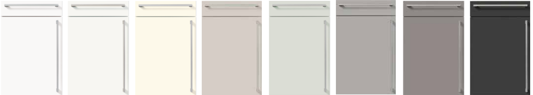
L091 Kristallweiß hochglanz