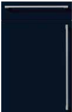
L481 Indigoblau hochglanz